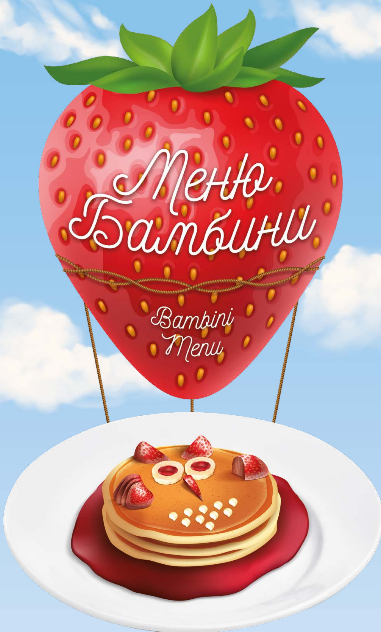
АПЕЛЬСИНОВЫЕ ПАНКЕЙКИ «СОВА» OWL ORANGE PANCAKES